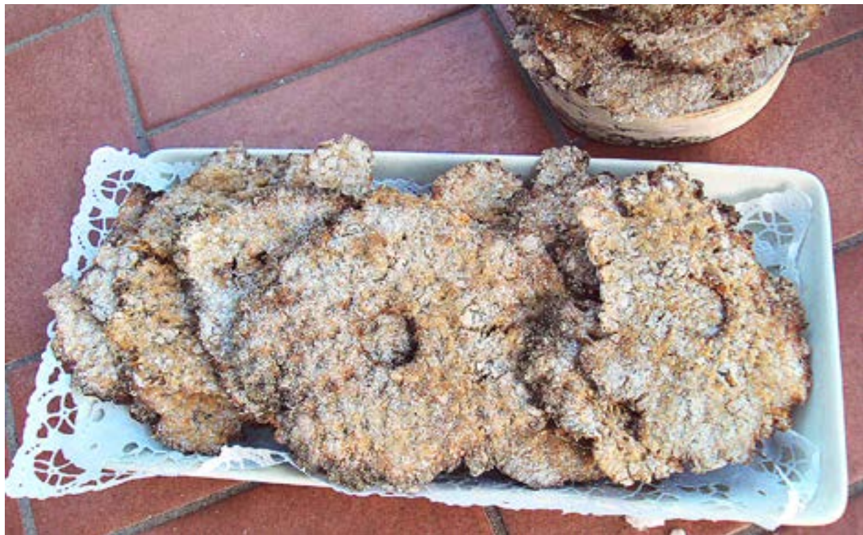
DET HÄR knäckebrödet smakar underbart gott med smör och ost. Förvaras torrt och luftigt.