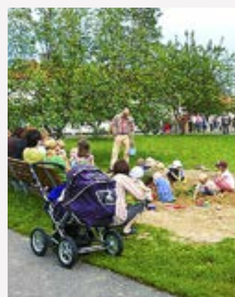
TEMAT FÖR årets upplaga av Kyrkans ungdoms sommarläger i Pieksämäki är "Frikänd!".

är i åldern 55+ ordnas ett seniorläger på Klippan 24–26 augusti. På programmet finns överraskningar som "skräpfiskbuffé", utfärd till dockmuseet i Pensala och cirkelträning.