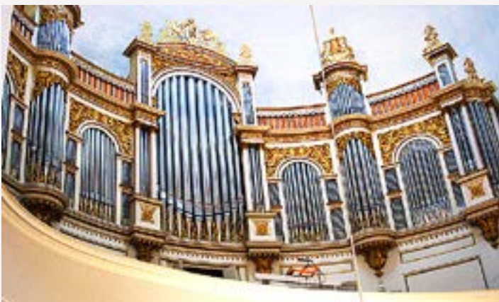
ORGELMUSIK KAN avnjutas på många håll i sommar, inte minst på Åland, i Pargas och Esbo.

Pargas har också sina egna Orgeldagar 23–27 juni. Tema i