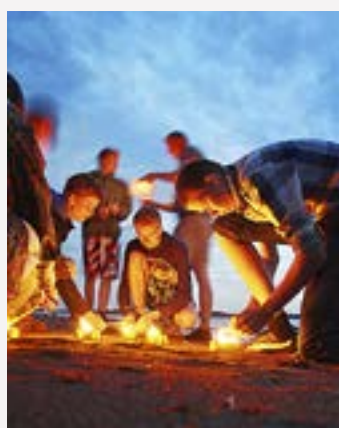
UNDER SOMMARDAGARNA på Lekholmen utlovas avslappat program.

Evangeliföreningen bjuder också till ungdomsläger 25–28 juli för ungdomar och unga vuxna i åldern 16–30 år. Ett tonårsläger med temat "Lead me to the cross" ordnas dessutom på Klippan 17–20 juli. Lägrekt riktar sig till ungdomar i åldern 13–16 år. "Under årets tonårsläger kommer vi att stanna upp inför korset och vad det betyder för oss människor i dag", står det i SLEF:s sommarbroschyr. För den som