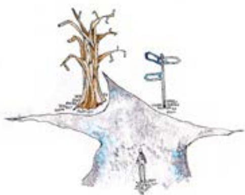
ILLUSTRATION: JOSEPHINE MICKELSSON