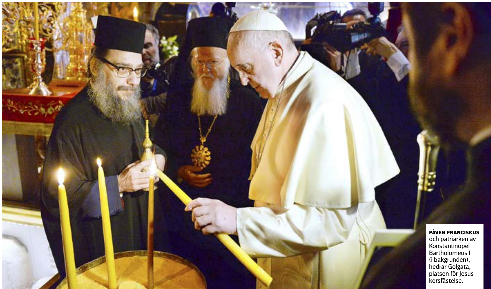
PÅVEN FRANCISKUS och patriarken av Konstantinopel Bartholomeus I (i bakgrunden), hedrar Golgata, platsen för Jesus korsfästelse.