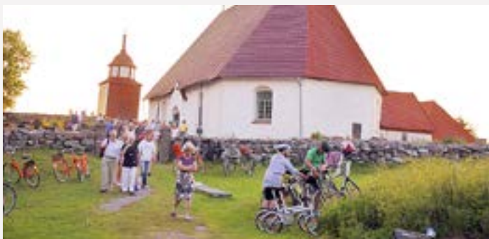
FRANCISKUSFESTEN PÅ Kökar har blivit ett begrepp som sträcker sig långt utanför Nordens gränser.