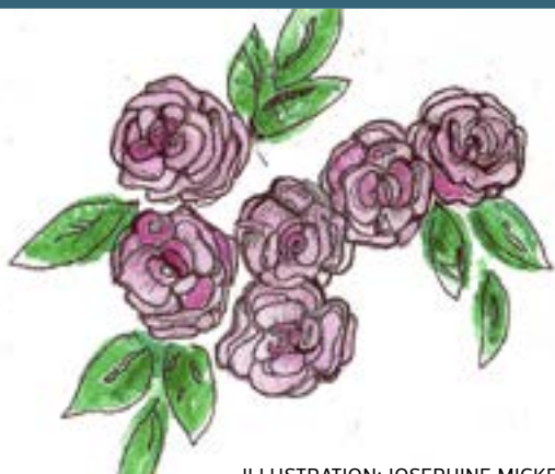
ILLUSTRATION: JOSEPHINE MICKELSSON