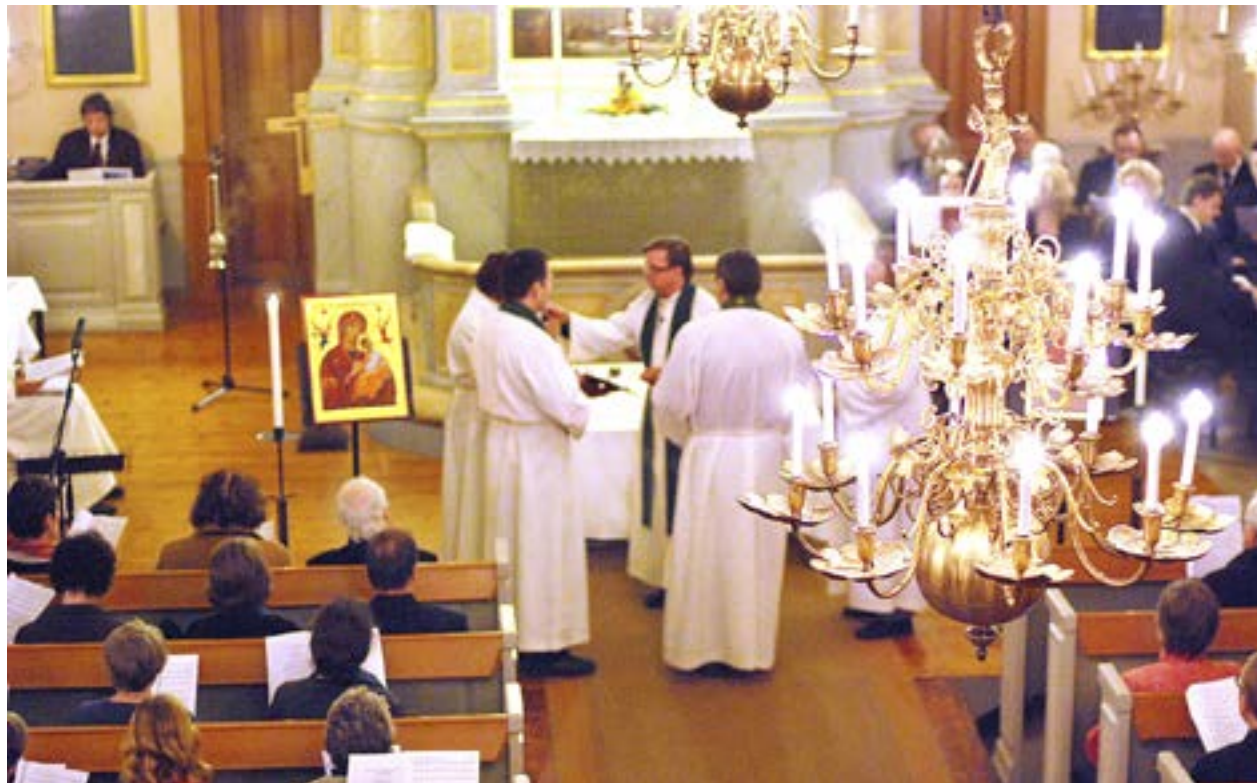
I GUDSTJÄNSTEN borde vi alla kunna mötas, trots olikheter och oberoende av ålder.