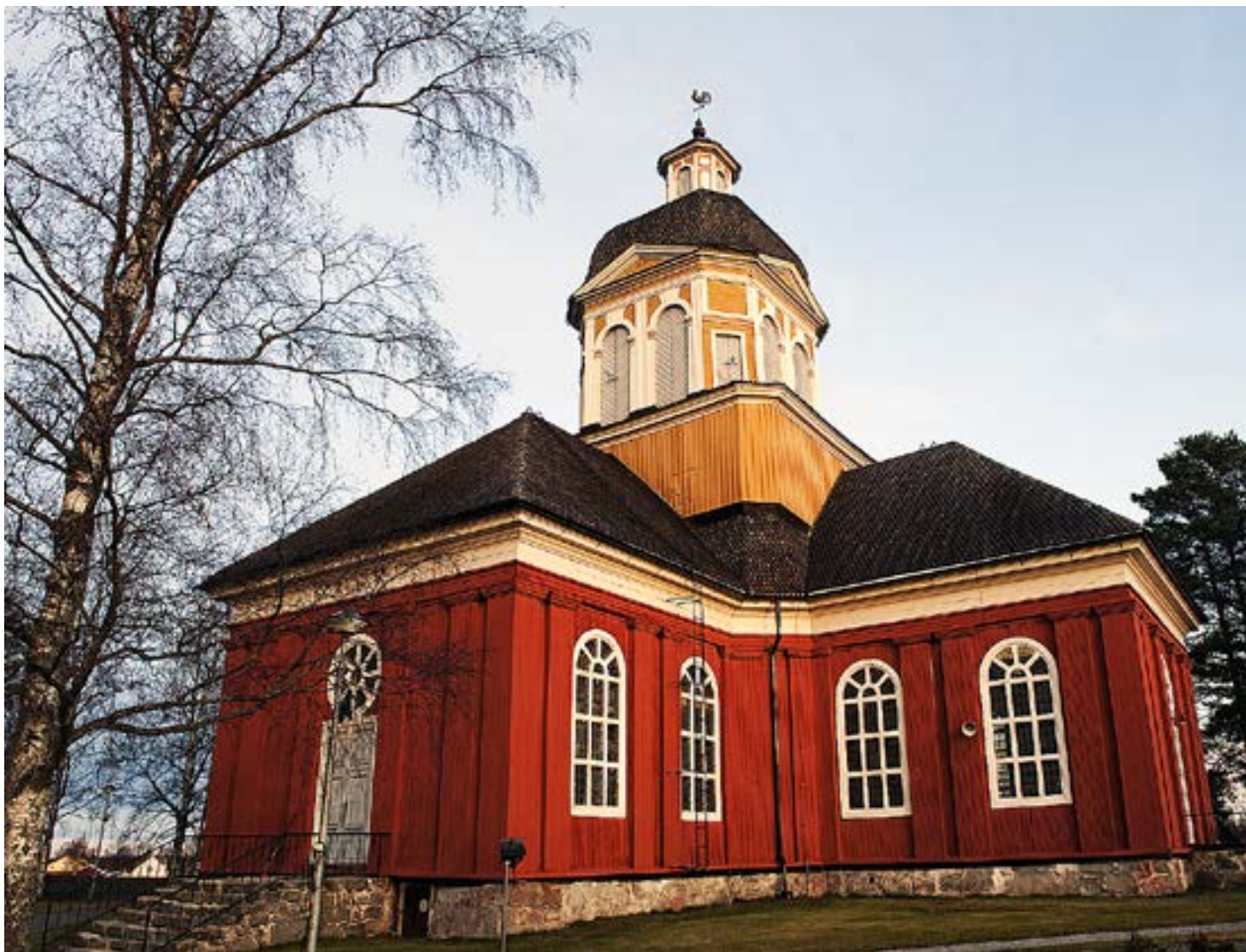
LARSMO FÖRSAMLING hör till de församlingar i Borgå stift som uppfyller miljödiplomets krav.

– Ett av de största bekymren med miljöarbetet är fortfarande att det finns ett stort gap mellan dem som driver frå-