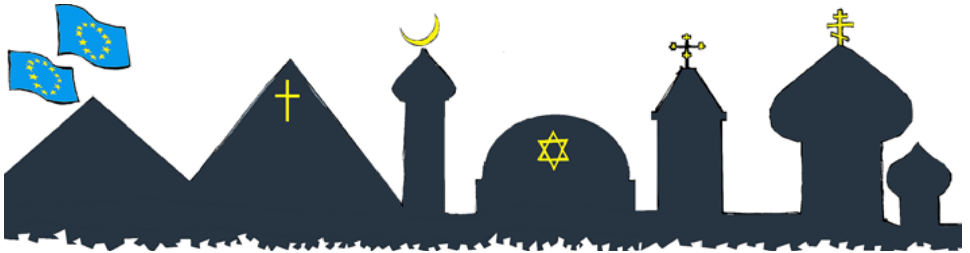
ILLUSTRATION: WILFRED HILDONEN