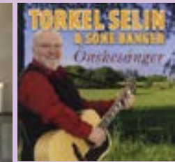
Torkel Selin Önskesånger CD.....17 €