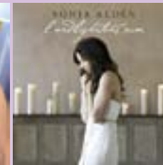
Sonja Aldén I andlighetens rum CD.....19 €