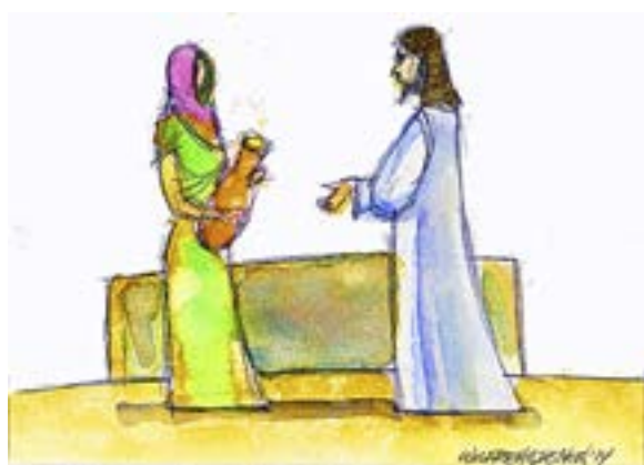
ILLUSTRATION: WILFRED HILDONEN