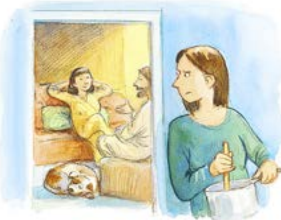
MARTA OCH MARIA. ILLUSTRATION: JENS AHLBOM, SVERIGE