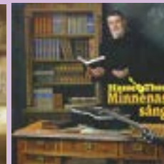
Hasse Thor Minnenas sång CD.....14 €