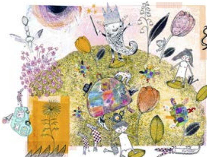
SKAPELSEBERÄTTELSEN. ILLUSTRATION: METTE MARCUSSEN, DANMARK

Bibelberättelser för barn i Norden har blivit till genom ett samarbete mellan sex nordiska förlag: Skálholtútgáfan (Island), Lasten Keskus (Finland), Fontana Media (Finland), IKO-förlaget (Norge), Verbum Förlag (Sverige) och Alfa (Danmark).