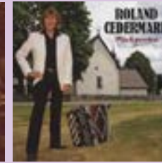
Roland Cedermark Pärleporten CD.....12 €