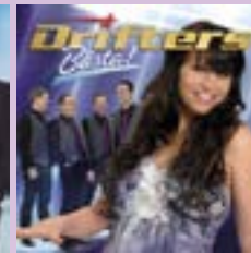
Drifters Bästa CD.....15 €