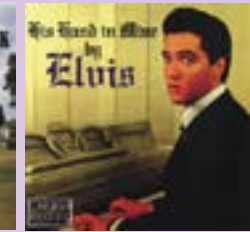
Elvis Presley His hand in mine CD.....12 €