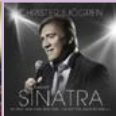
Christer Sjögren Sjunger Sinatra CD(utkommer 29.1.).....19 €