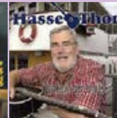
Hasse Thor Tankar som möts CD.....14 €