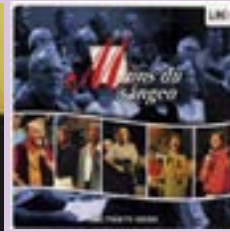
Minns du sången 3 CD.....20 €