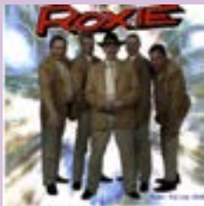
Roxie Vår bästa tid CD.....12 €