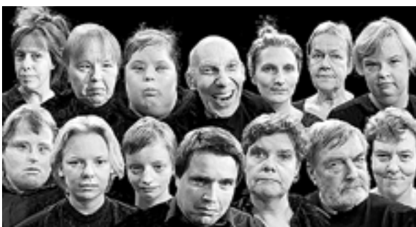
DEN BRINNANDE vargen är DuvTeaterns senaste satsning. Du kan se den fram till slutet av februari.

– Ändå har poesin aldrig tilldelats någon central roll i arbetet – inte förrän nu.