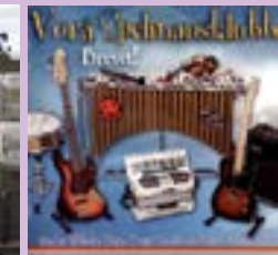
Vöra spelmansklubb Brevet CD.....19 €