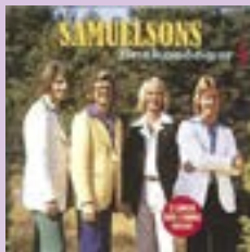
Samuelsons Önskelåtar 1 CD.....17 €