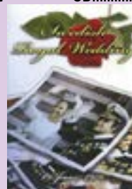
Kung Karl-Gustav och Silvias bröllop 1976 DVD.....9 €