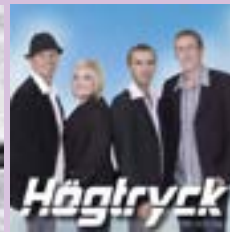
Högtryck Här och nu CD.....14 €