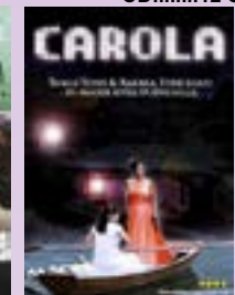
Carola Live at Dalhalla DVD.....15 €