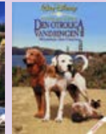
Den otroliga vandringen 2 DVD.....9 €