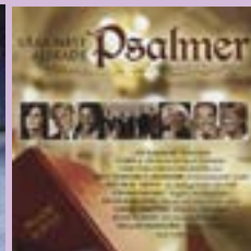
Våra mest älskade psalmer CD.....13 €