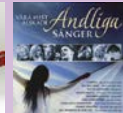
Våra mest älskade andliga sånger CD.....13 €