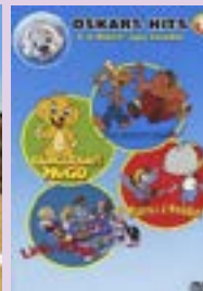
Oskars hits 1 DVD.....5 €