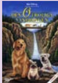
Den otroliga vandringen DVD.....9 €