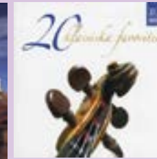
20 klassiska favoriter CD.....7 €