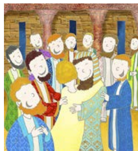
JOSEF MÖTER BRÖDERNA. ILLUSTRATION: TRYGVE SKOGRAN, NORGE