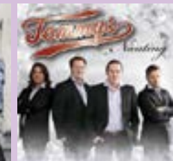
Tommys Nänting CD.....17 €