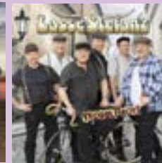
Lasse Stefanz Trouble Boys CD.....17 €