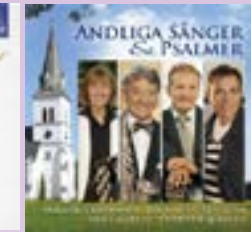
Andliga sånger & psalmer CD.....13 €