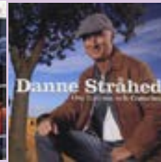
Danne Stråhed Om himlen och Österlen 2 CD.....15 €