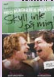
Magnus & Brasse Skyll inte på mig! DVD.....9 €