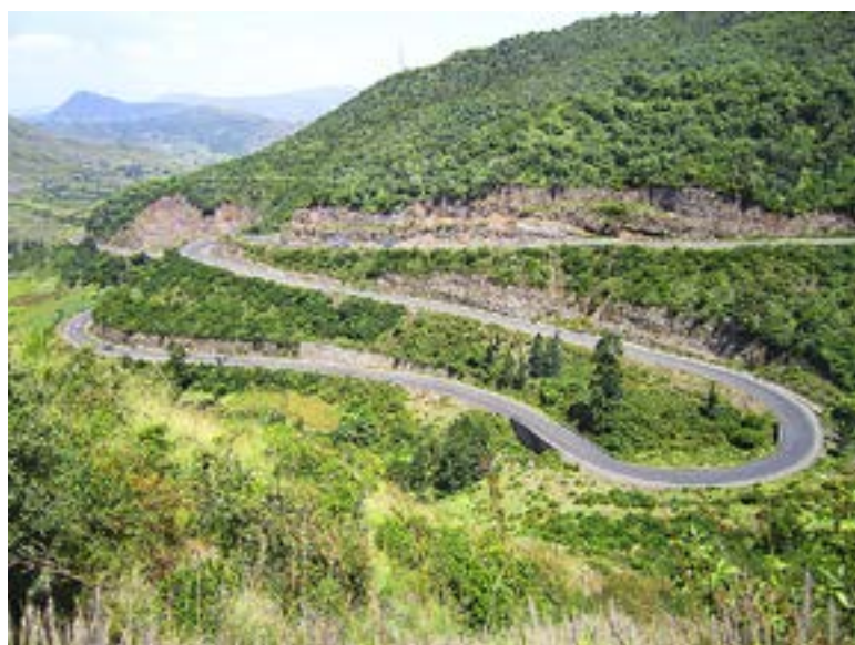
SERPENTINVÄG MELLAN Dessie (2 600 m.ö.h.) och Kombolcha (1 800 m.ö.h.).