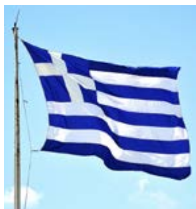
DEN GREKISKA regeringen hoppas på tillväxt för år 2014.

De internationella långivarna drog öronen åt sig och Greklands kreditvärddighet sjönk så att landet till sist inte