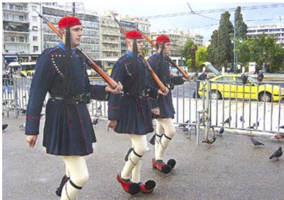
EVZONES, SOLDATER i traditionell dräkt och tofsprydda skor, på vakt. Från den intelligande parlamentsbyggnaden har det de senaste åren mest skrivits ut besk medicin.