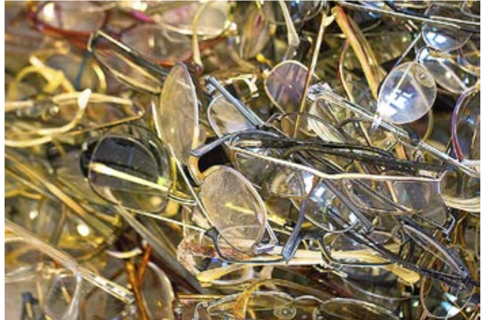
MARIEHAMNS FÖRSAMLING samlade in 352 par glasögon tillsammans med Agenda 21 och de lokala optikerna.

Mobiltelefonerna skickas till en organisation som arbetar med att dels reparera och sälja vidare mobiltelefoner och dels med att plocka isär trasiga telefoner och ta till vara de komponenter som är av värde. För de inlämnade mobilerna får församlingen en summa pengar beroende på mobilernas skick. Peng-