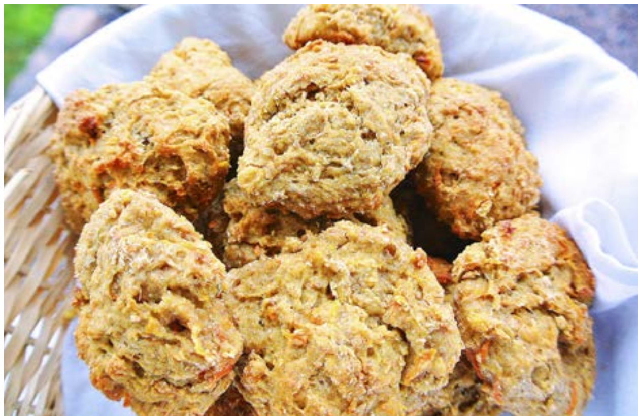
RIVEN MOROT gör semlorna extra saftiga.