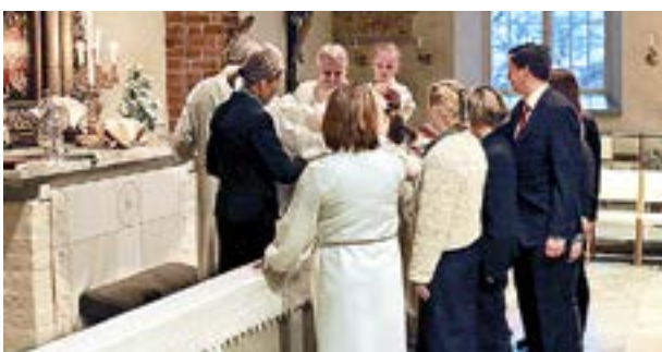
VÄSTÅBOLANDS SVENSKA församling har fått både ny kaplan och församlingsspastor.

– För närvarande finns inte något tryck på att