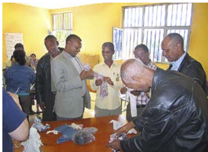
EVANGELISTER OCH söndagsskollärare tillverkar dockor av tomma plastflaskor och wc-pappersrullar.

Jag var framme i Addis redan klockan ett. Den 400 km långa vägen är i gott skick och bussen var modern, men höjdskillnaderna är enorma, över två kilometer mellan den lägsta och den högsta punkten. Det här är något som ofta ger mig huvudvärk. Den här gången hann jag beundra utsikten eftersom jag inte körde själv. Taxiresan från bussen till FMS gästhus tog ytterligare ett par timmar, eftersom jag levererade ett par brev till ett par olika adresser under vägen.