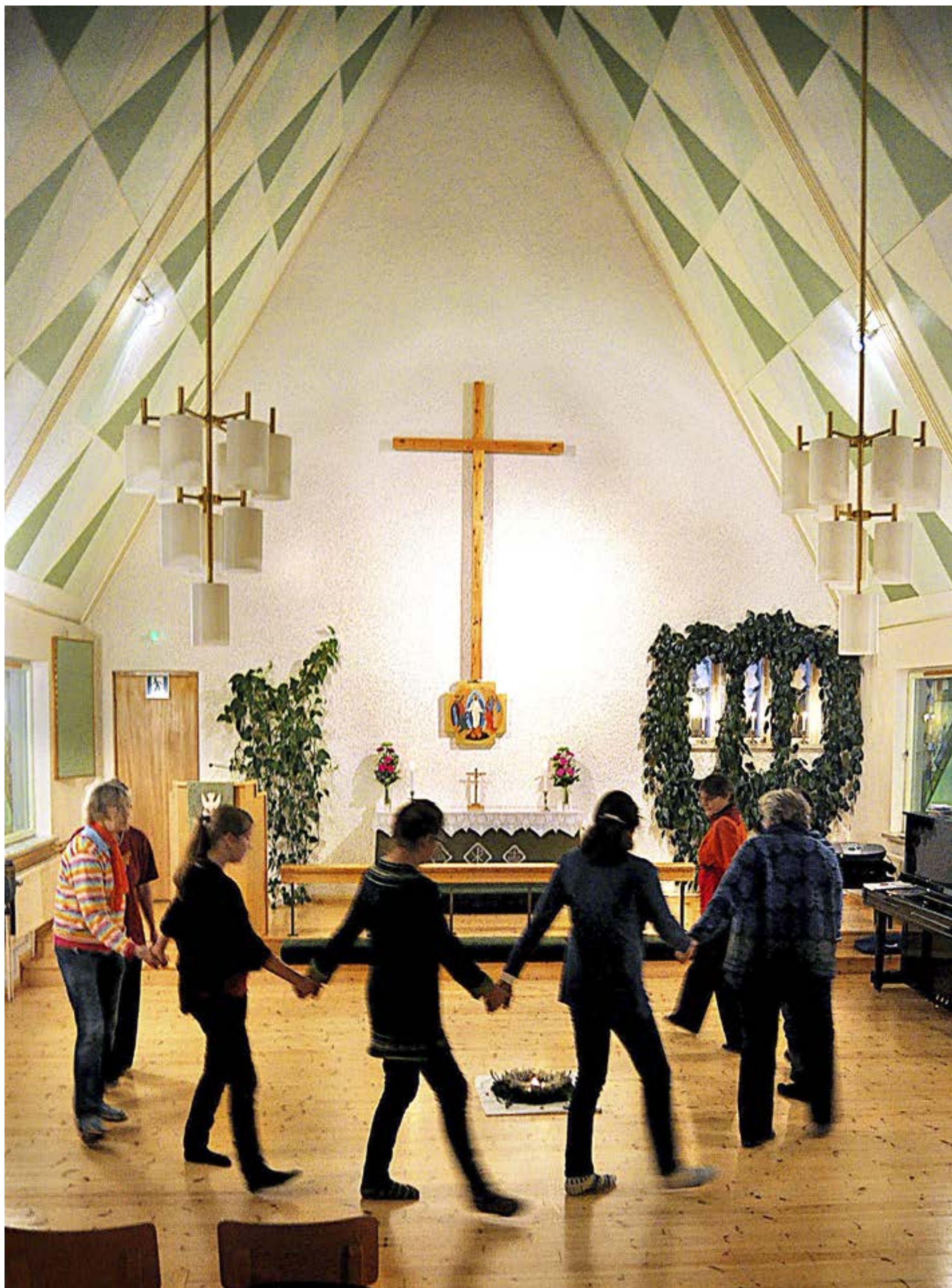
STEGEN ÄR lugna och enkla. I dansen ligger fokus på gemenskapen och den inre bönen. Mitt i cirkeln står ett ljus som symboliserar Kristus.