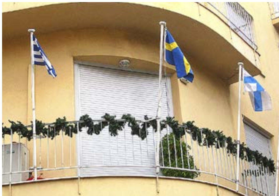
SKANDINAVISKA KYRKAN är centralt belägen i nöjesområdet Plaka.