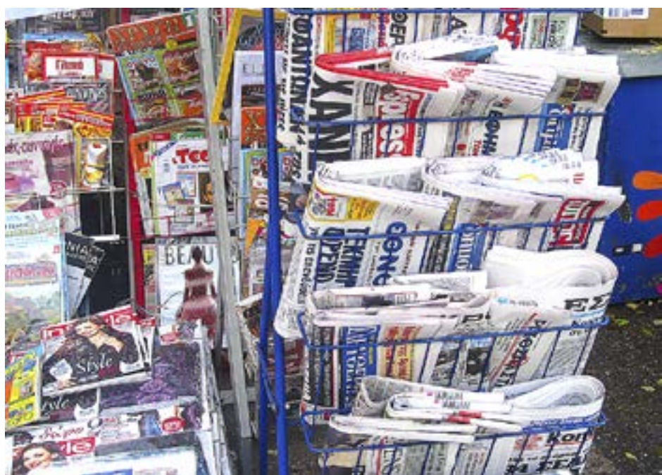
I GREKLAND är det vanligare att man köper än prenumererar på en tidning. För 2014 kan tidningarna rapportera om en förväntad tillväxt på drygt en halv procent.