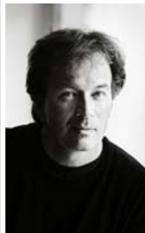
KJELL WESTÖ skriver övertygande om Helsingfors år 1938.

Kontoristen Matilda Wiik släpar på förlamade kroppsdelar också hon. En gång var hon en ung flicka som hette Milja, men den flickan blev kvar i det röda fånglägret tillsammans med alla dem som svalt ihjäl. Sedan händer det hemska: kaptenen från lägret dyker upp på hennes jobb. Han är medlem i Thunes Onsdagsklubb, han är mycket äldre