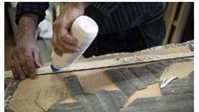
TAVLORNA ÄR som att bygga ett pussel där han börjar med att tälja bitarna ... och passar in dem ... för att slutligen limma fast dem.