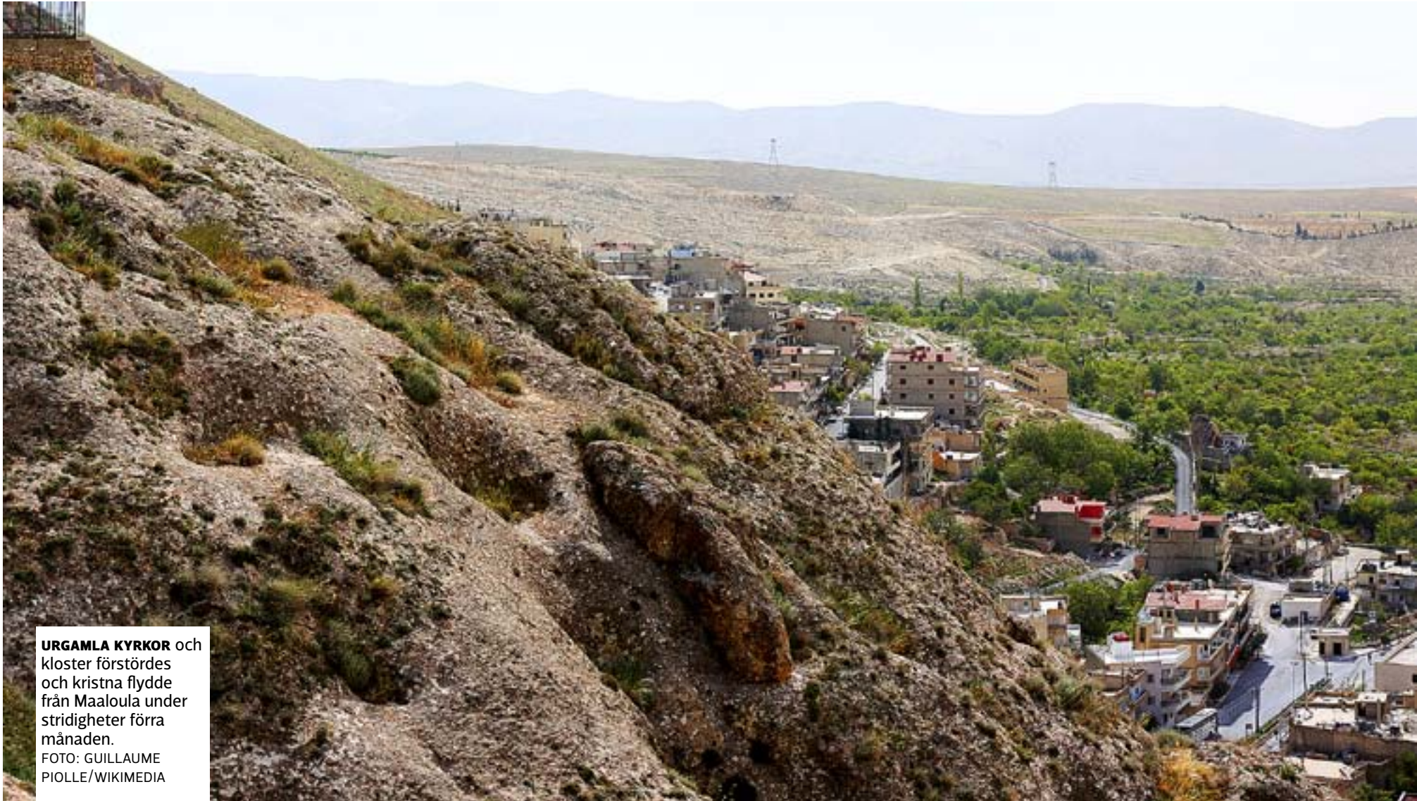
URGAMLA KYRKOR och kloster förstördes och kristna flydde från Maaloula under stridigheter förra månaden.