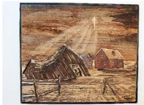
JESU FÖDELSE i ett österbottniskt landskap.